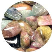
Tourmaline melon d'eau