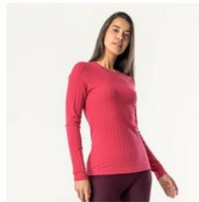
T-shirt SAPHIRA à manches longues côtelé - LIVING CRAFTS