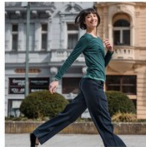
Top SUSANNA 100% coton bio - LIVING CRAFTS