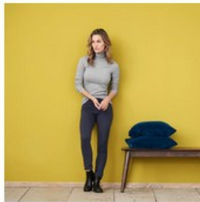
Col roulé HOLDINE coton biologique - LIVING CRAFTS