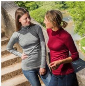
Col roulé femme 70% Laine 30% Soie - ENGEL