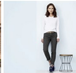
T-shirt à manches longues FIONA en coton bio - LIVING CRAFTS