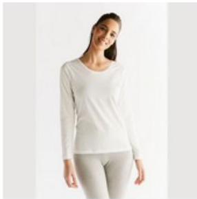
T-shirt manches longues - LEELA COTTON

Filtre : Marque Type de produit Couleur Trier par : Meilleures ventes 40 produits Taille Prix